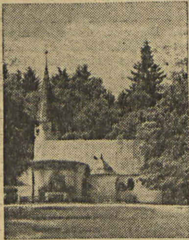
O Santuário de Maria Eich, na Alemanha, aonde em cada dia 13, muitos fiéis vêm em devota peregrinação em honra de Nossa Senhora da Fátima.

No dia 13 de Julho às duas horas da tarde fiz a minha peregrinação anual ao santuário de Maria Eich, situado no meio duma floresta perto de Planegg, distante de Munich quatro estações de caminho de ferro. Ali